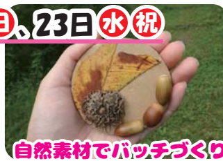
自然素材でパッチづくり

時間 14:00~14:30 / 参加費 無料 対象 どなたでも(就学前の子どもは保護者の参加が必要)