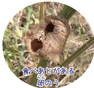
食べあとがある卵のう

卵が食べつくされるとカマキリはいなくなってしまうですが、毎年春にはカマキリの幼虫が生まれています。つまり、食べられずに冬を越した卵のうがあるということです。卵のうをめぐって、それを食べるために狙う生き物と子孫を残したい親カマキリと、それぞれの思惑があるように感じます。【解説員 宝槻】