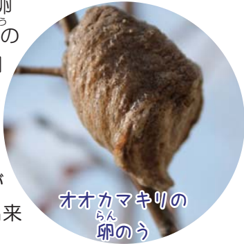
オオカマキリの卵のう

秋になると、園内のいたるところでカマキリの卵のうを見かけ始めます。カマキリの卵のうは、卵を包んでいる袋状のもののことで、中には200個以上もの卵が入っています。春になると卵のうからたくさんのカマキリが産まれてきますが、実は全ての卵のうが無事に冬を乗り切ることが出来るとは限りません。