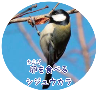
たまご卵を食べるシジュウカラ

カマキリの卵は、食べ物が少ないこれからの時期には、他の生き物にとって貴重な食べ物になります。例えば、シジュウカラなどの鳥です。食べられたあとなのか、欠けている卵のうもよく見かけます。