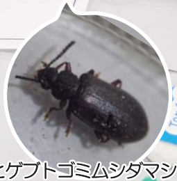
ヒゲトゴミムシダマシ