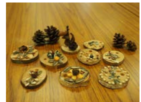
木の実のクラフト