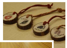
動物こしせまストラップ

御岳山の木の実を使ったブローチづくりや御岳山 で暮らす生きものの痕跡をモチーフにしたキーホ ルダーづくりなどを実施しています。実費として 材料費がかかります。