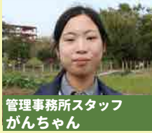
管理事務所スタッフ がんちゃん