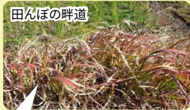
田んぼの畔道 「草紅葉(くさもみじ)」とも言い、晩秋の季語でもあります。