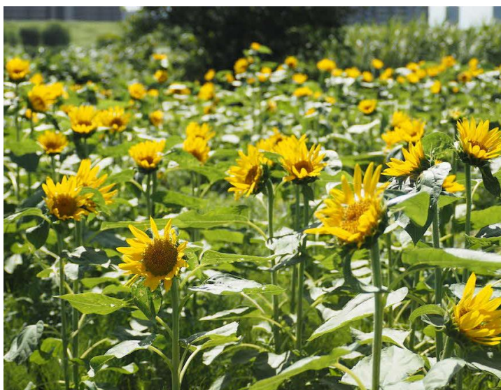
▲2022年ヒマワリ花壇の様子