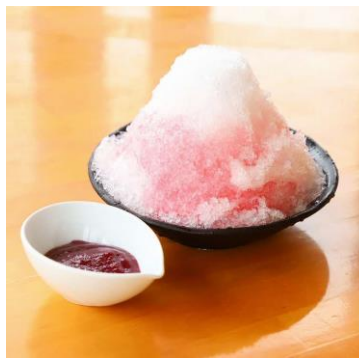
▲富士山かき氷（ヤマモモ）600円