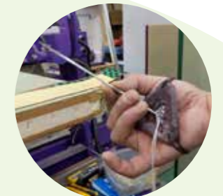
むかし どうぐ はり さ 昔ながらの道具、針を刺すためにかわせいあもの手に革製の当て物をつける

畳表を張り替えたら、機械で端の余分を切り落とし、畳縁を縫い付けて完成です。昔は太くて長い針や大きな刃物を使ってやっていた作業です。