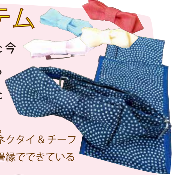
たたみべりせい がた 畳縁製のリボン型ブローチ

なかなか畳に触れる機会が少なくなった今の生活の中で、小川畳店では「畳に触れる機会を増やそう!」と、畳の素材を使った小物、今までになかったデザインの畳縁を取り入れた畳も扱っていますよ!