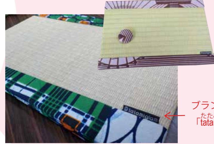
わふく 和服デザイナーさんとコラボした畳縁。アフリカンテイストで斬新な仕上がり!