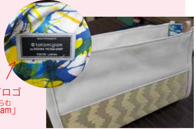
ブランドロゴ たたみぐらむ 「tatamiglam」