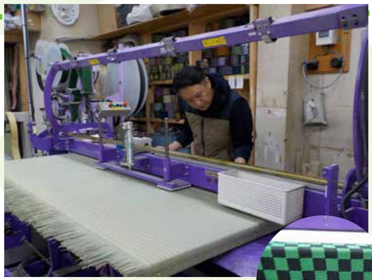
たたみべりぬ つ りょうようき 畳縁を縫い付ける「両用機」 右の畳縁は人気漫画『鬼滅の刃』の主人公、竈門炭治郎をイメージしたカラー

小川畳店は、熊本県のイグサ(畳表の材料)農家さんとの繋がりが深く、品質の良い畳表を比較的安く提供できるのが強みです!