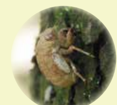
ニイニゼミの抜け殻 体長約1~1.5cm。 全体に泥がついている。

この夏、みなさんはどのセミに出会えるでしょうか?成虫を見つけたら、ぜひ抜け殻も探してみてください。