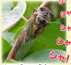
クマゼミの成虫。 体長約6~7cm。 大きな黒い体の特徴的。