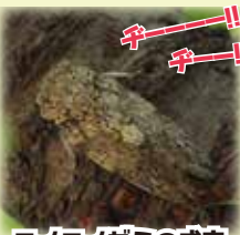
ニイニゼミの成虫。 体長約2~2.4cm。 木の枝にそっくり。 見つけられるかな?