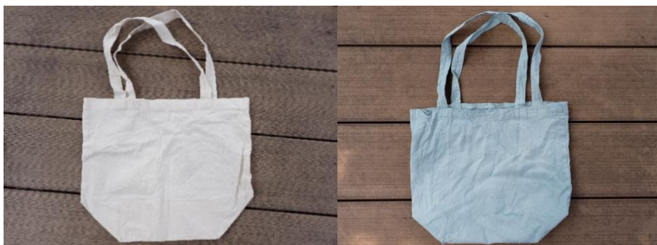
トートバック (28 cm × 32 cm) 48 g / 綿 100%